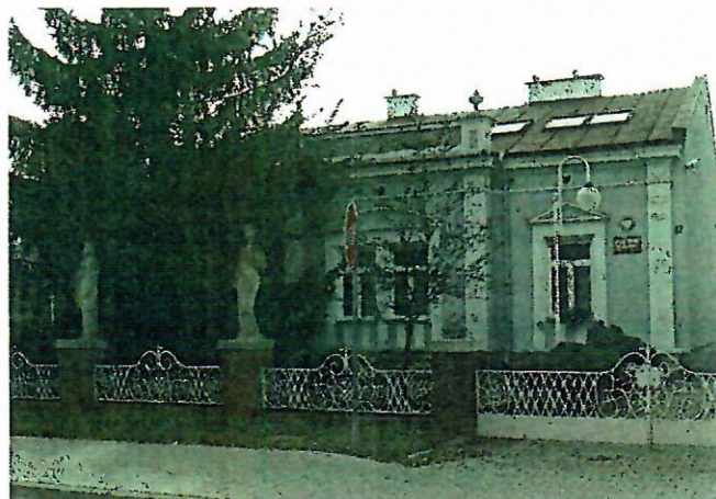
Fot. nr 12. Willa Saskich, ob. USC, ul. Siennieńska 47

Dworek inż. Straussa , ul. Siennieńska 37, wzniesiony ok. 1915 r. w stylu dworkowym. Parterowy budynek nakryty dwuspadowym dachem, z pseudoryzalitem zwieńczonym pełnym murkiem attykowym – w skrajnej osi fasady i prostokątnym podcieniem wspartym na czterech kolumnach, zaakcentowanym trójkątnym frontonem. Ściany murowane, boniowane, wokół okien i drzwi opaski i odcinki gzymsu.