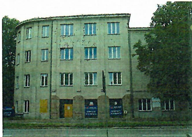
Fot. 2. Dom Robotniczy, Zakładowy Dom Kultury, ob. m.in. kino „Etiuda” i Centrum Tradycji Hutnictwa, Al. 3 Maja 6

Gmach Poczty , Aleja 3 Maja 12, wzniesiony w latach 1926-1927 wg projektu Witolda Minkiewicza. Dwukondygnacyjny budynek nakryty wysokim czterospadowym dachem, z rozległą facjatą w szerokości płytkiego frontowego ryzalitu. Wyróżnia się monumentalną kolumnadą w stylu palladiańskim wprowadzoną w prostokątnym podcieniu frontowego ryzalitu. Walorem budynku jest prostota i monumentalizm bryły niemal pozbawionej detali zdobniczych.