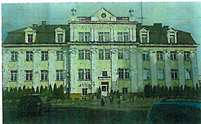
Fot. 6. Kasa Chorych, ob. Hospicjum Dom Ulgi w Cierpieniu im. Jana Pawła II, ul. Focha 5

Bank Pfeffera, ob. Komenda Powiatowa Policji, Al. 3 Maja 7 , wg projektu Stefana Szyllera. Dwukondygnacyjny, o symetrycznie skomponowanej fasadzie podzielonej ujętą w gzymsy strefą międzykondygnacyjną, w trzech osiach środkowych wzbogaconą obszernym balkonem wspartym na konsolach. Poziomo boniowany parter przepruty jest prostokątnymi oknami ze zwornikami w nadprożu, okna piętra - zamknięte łukiem okrągłym - zestawione po trzy, ujęte są szerokimi opaskami z dekoracją płycinową na wysokości węgarów; między oknami osi środkowych i w narożach wprowadzono pary pilastrów. Jest to wystrój eklektyczny korzystający z zasobów elementów dekoracyjnych baroku i renesansu.