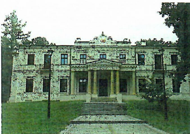
Fot. nr 7. Pałac Wielopolskich, ob. Muzeum Historyczno-Archeologiczne ul. Świętokrzyska 37

Budynek dawnej Kasy Chorych, ob. Środowiskowy Dom Samopomocy dla Osób Niepełnosprawnych Intelktualnie oraz Dom Ulgi w Cierpieniu im. Jana Pawła II, ul. Focha 5. Zbudowany w latach 1925-1927, zbudowany wg projektu R. Weindlinga (?) - nietypowy dla twórczości tego modernistycznego architekta, gdyż prezentuje walory neobaroku. Monumentalny, założony na rzucie litery E, trójkondygnacyjny, nakryty wysokimi czterospadowymi dachami rozczłonkowanymi lukarnami. Na osi fasady i w narożach elewacji - ryzality, z których fasadowy zwieńczony jest rozległą, prostokątną facją z trójkątnym szczytem. W wystroju fasady dominują pilastry w porządku wielkim, z jońskimi głowicami. Budynek po remoncie.