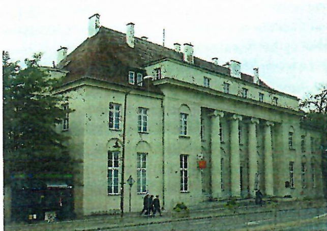
Fot.1. Budynek Poczty, Al. 3 Maja 12

Wymienieni architekci i urbaniści byli twórcami najważniejszych obiektów architektonicznych Ostrowca Świętokrzyskiego powstałych w okresie 4 ćw. XIX w.-lata 50. XX w. Najcenniejszymi, ze względu na unikatowość architektury są budynki: