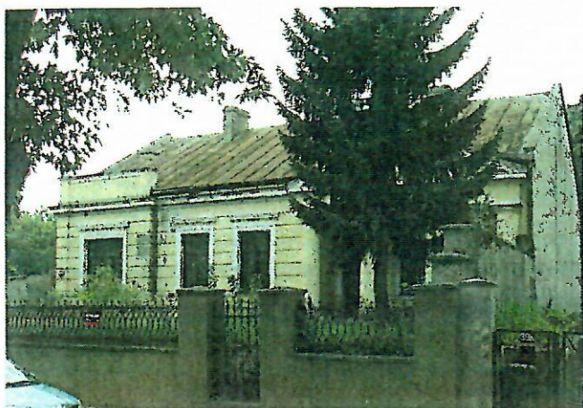
Fot. nr 11. Dworek inż. Straussa, ul. Siennieńska 37