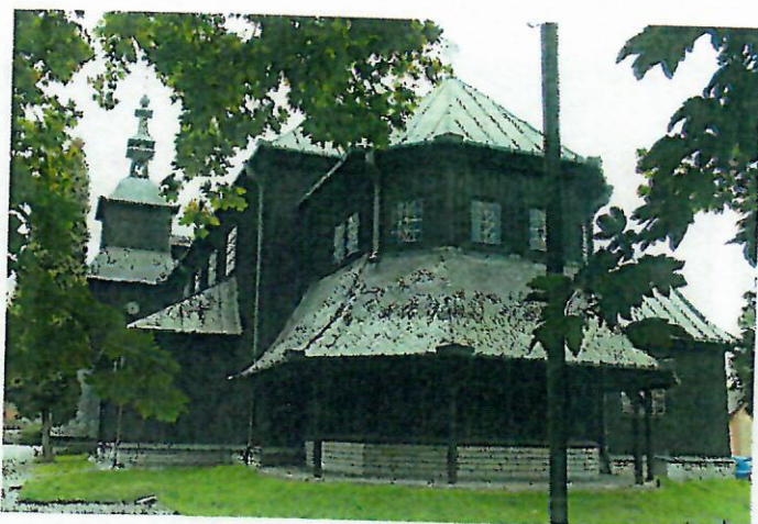
Fot. nr 3. Kościół pw. Najświętszego Serca Jezusowego, ul. Poniatowskiego 4

Spośród obiektów sakralnych najbardziej wartościowymi pod względem walorów architektonicznych, artystycznych i historycznych są: