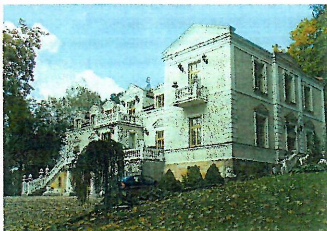
Fot. nr 8. Pałacyk myśliwski Wielopolskich, ob. Hotel Pałac Tarnowskich, ul. Kuźnia 54

Pałac Wielopolskich, ob. Muzeum Historyczno-Archeologiczne, ul. Świętokrzyska 37. Zbudowany w latach 1887 - 1899, wg projektu L.J.L. Marconiego, w stylu eklektycznym z elementami klasycyzmu. Dwukondygnacyjny, podpiwniczony budynek murowany, tynkowany z boniowaniem naroży, na rzucie wydłużonego prostokąta, nakryty czterospadowym dachem. Na osi elewacji wsch. i zach. - ryzality.