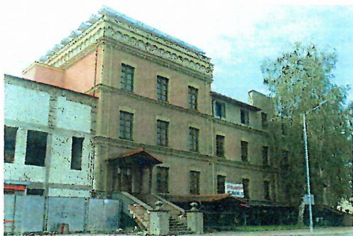
Fot. nr 13. Hotel Fabryczny, ul. Sandomierska 4

Pozostałe obiekty zabytkowe, wartościowe dla krajobrazu kulturowego miasta to: dawny hotel fabryczny wzniesiony w 1905 r., z elementami neogotyckimi w wystroju oraz budynek dworca PKP wzniesiony w latach 1885-1886, w stylu typowym dla budynków dworców kolejowych tego okresu (obiekt nieczynny, ulega degradacji).