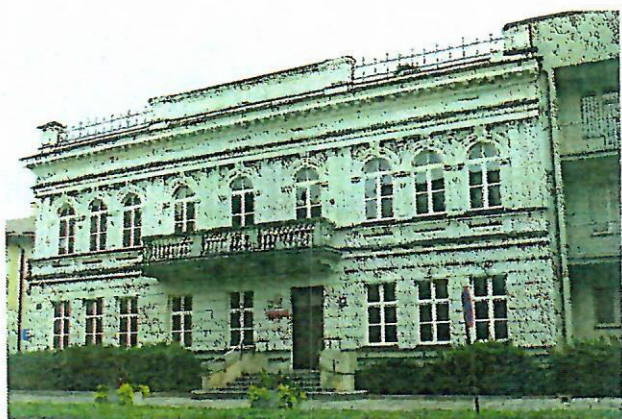
Fot. nr 5. Bank Pfeffera, ob. Komenda Powiatowa Policji, ul. Al. 3 Maja 7

Spośród innych budynków, ze względu na prezentację walorów stylów historycznych, wymienić należy: