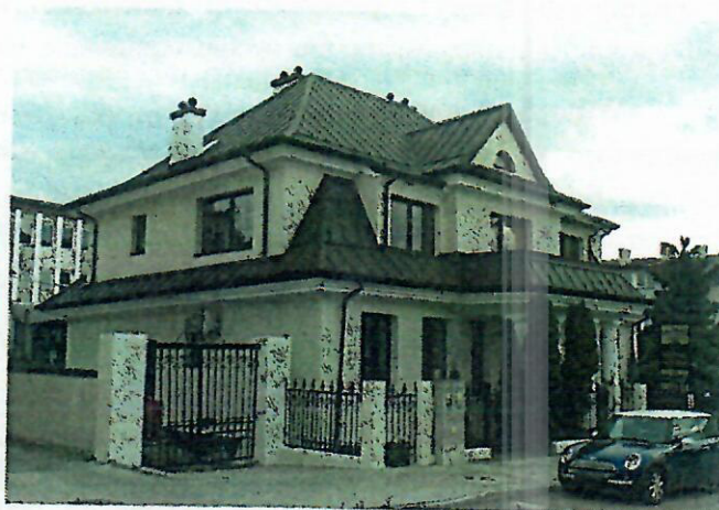
Fot. nr 9. Pałacyk Rylla, ob. budynek nieużytkowany, Al. 3 Maja 13a