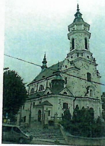
Fot. nr 4. Kolegiata pw. św. Michała Archanioła, ul. Okólna 19

Kościół parafialny pw. Najświętszego Serca Jezusowego , tzw. fabryczny, ul. Poniatowskiego 4, zabudowany w 1932 r. w stylu zakopiańskim, wg projektu Tadeusza Rekirowicza. Wzniesiony z drewna modrzewiowego na podmurówce licowanej kamieniem, trójnawowy z węższym, trójbocznie zamkniętym prezbiterium, ujęty zadaszonym obejściem (soboty). W narożu fasady - wieża na rzucie kwadratu zwieńczona dzwonowatym hełmem z latarnią. Na czterospadowym dachu głównym - sygnaturka. Wnętrze doświetlone rzędem gęsto rozmieszczonych okien z witrażami, na ścianach intarsjowana boazeria.