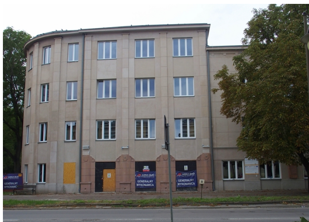
Fot. 2. Dom Robotniczy, Zakładowy Dom Kultury, ob. m.in. kino „Etiuda” i Centrum Tradycji Hutnictwa, Al. 3 Maja 6

Gmach Poczty , Aleja 3 Maja 12, wzniesiony w latach 1926-1927 wg projektu Witolda Minkiewicza. Dwukondygnacyjny budynek nakryty wysokim czterospadowym dachem, z rozległą facjatą w szerokości płytkiego frontowego ryzalitu. Wyróżnia się monumentalną kolumnadą w stylu palladiańskim wprowadzoną w prostokątnym podcieniu frontowego ryzalitu. Walorem budynku jest prostota i monumentalizm bryły niemal pozbawionej detali zdobniczych.