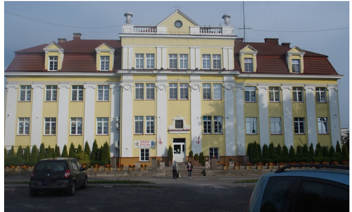
Fot. 6. Kasa Chorych, ob. Hospicjum Dom Ulgi w Cierpieniu im. Jana Pawła II, ul. Focha 5

Bank Pfeffera, ob. Komenda Powiatowa Policji, Al. 3 Maja 7 , wg projektu Stefana Szyllera. Dwukondygnacyjny, o symetrycznie skomponowanej fasadzie podzielonej ujętą w gzymsy strefą międzykondygnacyjną, w trzech osiach środkowych wzbogaconą obszernym balkonem wspartym na konsolach. Poziomo boniowany parter przepruty jest prostokątnymi oknami ze zwornikami w nadprożu, okna piętra - zamknięte łukiem okrągłym - zestawione po trzy, ujęte są szerokimi opaskami z dekoracją płycinową na wysokości węgarów; między oknami osi środkowych i w narożach wprowadzono pary pilastrów. Jest to wystrój eklektyczny korzystający z zasobów elementów dekoracyjnych baroku i renesansu.