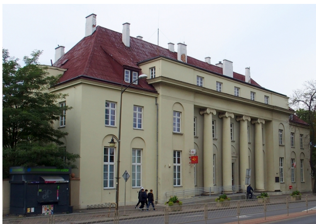
Fot.1. Budynek Poczty, Al. 3 Maja 12

Wymienieni architekci i urbaniści byli twórcami najważniejszych obiektów architektonicznych Ostrowca Świętokrzyskiego powstałych w okresie 4 ćw. XIX w.-lata 50. XX w. Najcenniejszymi, ze względu na unikatowość architektury są budynki: