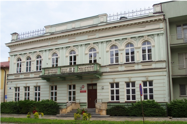
Fot. nr 5. Bank Pfeffera, ob. Komenda Powiatowa Policji, ul. Al. 3 Maja 7

Spośród innych budynków, ze względu na prezentację walorów stylów historycznych, wymienić należy: