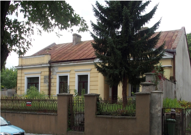
Fot. nr 11. Dworek inż. Straussa, ul. Siennieńska 37