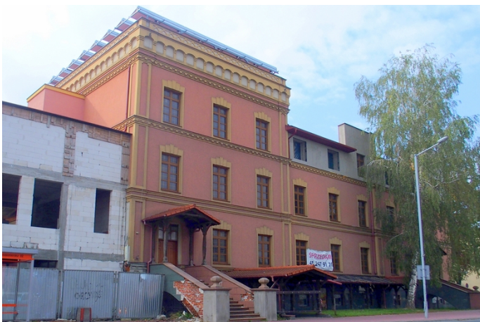
Fot. nr 13. Hotel Fabryczny, ul. Sandomierska 4

Pozostałe obiekty zabytkowe, wartościowe dla krajobrazu kulturowego miasta to: dawny hotel fabryczny wzniesiony w 1905 r., z elementami neogotyckimi w wystroju oraz budynek dworca PKP wzniesiony w latach 1885-1886, w stylu typowym dla budynków dworców kolejowych tego okresu (obiekt nieczynny, ulega degradacji).