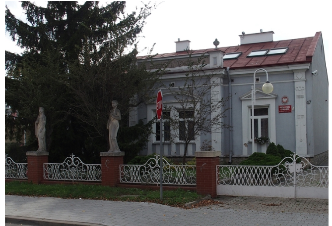
Fot. nr 12. Willa Saskich, ob. USC, ul. Siennieńska 47

Dworek inż. Straussa , ul. Siennieńska 37, wzniesiony ok. 1915 r. w stylu dworkowym. Parterowy budynek nakryty dwuspadowym dachem, z pseudoryzalitem zwieńczonym pełnym murkiem attykowym – w skrajnej osi fasady i prostokątnym podcieniem wspartym na czterech kolumnach, zaakcentowanym trójkątnym frontonem. Ściany murowane, boniowane, wokół okien i drzwi opaski i odcinki gzymsu.