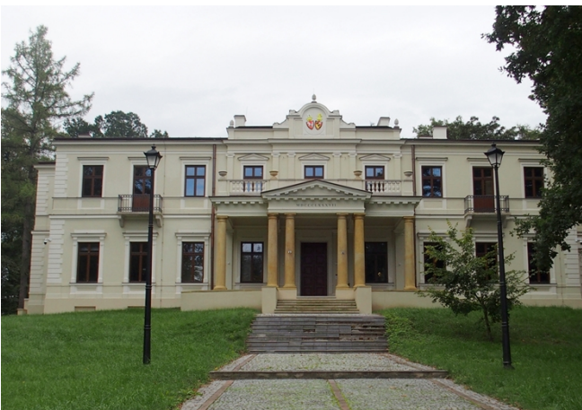
Fot. nr 7. Pałac Wielopolskich, ob. Muzeum Historyczno-Archeologiczne ul. Świętokrzyska 37

Budynek dawnej Kasy Chorych, ob. Środowiskowy Dom Samopomocy dla Osób Niepełnosprawnych Intelaktnie oraz Dom Ulgi w Cierpieniu im. Jana Pawła II, ul. Focha 5. Zbudowany w latach 1925-1927, zbudowany wg projektu R. Weindlinga (?) - nietypowy dla twórczości tego modernistycznego architekta, gdyż prezentuje walory neobaroku. Monumentalny, założony na rzucie litery E, trójkondygnacyjny, nakryty wysokimi czterospadowymi dachami rozczłonkowanymi lukarnami. Na osi fasady i w narożach elewacji - ryzality, z których fasadowy zwieńczony jest rozległą, prostokątną facjatą z trójkątnym szczytem. W wystroju fasady dominują pilastry w porządku wielkim, z jońskimi głowicami. Budynek po remoncie.