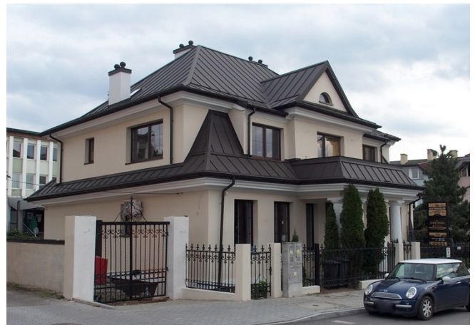
Fot. nr 9. Pałacyk Rylla, ob. budynek nieużytkowany, Al. 3 Maja 13a Fot. nr 10. Willa Żakowskich, ul. Siennieńska 14

Pałacyk Rylla, ob. budynek nieużytkowany , Al. 3 Maja 13a, zbudowany w 1910 r. Wysoko podpiwniczony budynek z parą wydatnych ryzalitów w skrajnych częściach fasady, ujmujących jednobiegowe schody; z cylindrycznym aneksem w elewacji pld., nakryty wysokimi dachami. Pld. ryzalit zwieńczony jest trójkątną facjatą ujętą w spływy wolutowe z kotarowym zwieńczeniem. Budynek eklektyczny.