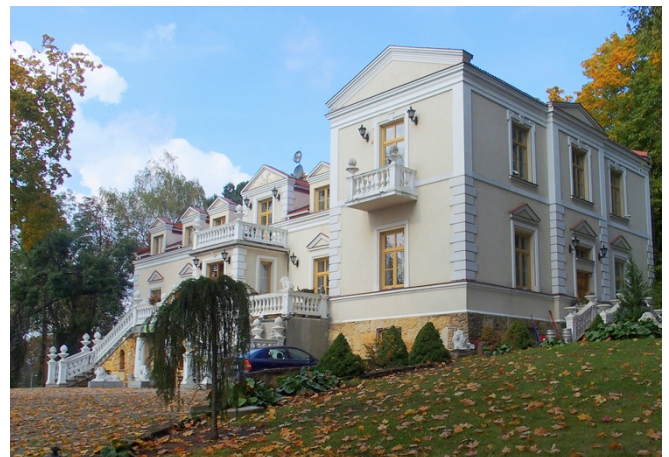
Fot. nr 8. Pałacyk myśliwski Wielopolskich, ob. Hotel Pałac Tarnowskich, ul. Kuźnia 54

Pałac Wielopolskich, ob. Muzeum Historyczno-Archeologiczne, ul. Świętokrzyska 37. Zbudowany w latach 1887 - 1899, wg projektu L.J.L. Marconiego, w stylu eklektycznym z elementami klasycyzmu. Dwukondygnacyjny, podpiwniczony budynek murowany, tynkowany z boniowaniem naroży, na rzucie wydłużonego prostokąta, nakryty czterospadowym dachem. Na osi elewacji wsch. i zach. - ryzality.