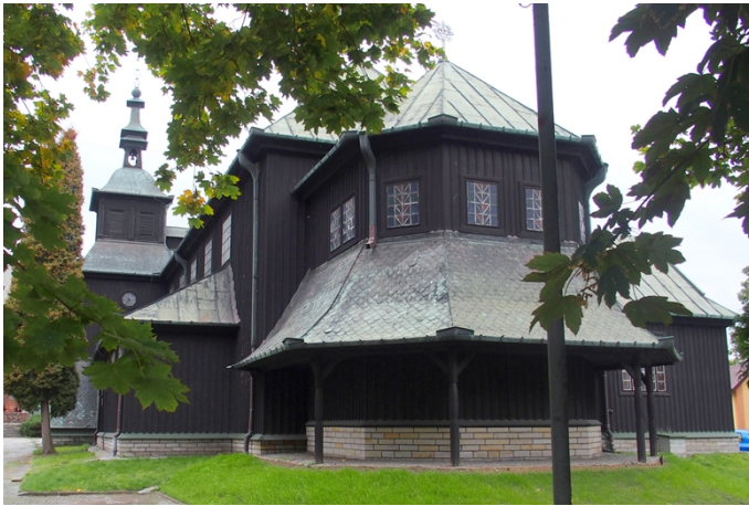
Fot. nr 3. Kościół pw. Najświętszego Serca Jezusowego, ul. Poniatowskiego 4

Spośród obiektów sakralnych najbardziej wartościowymi pod względem walorów architektonicznych, artystycznych i historycznych są: