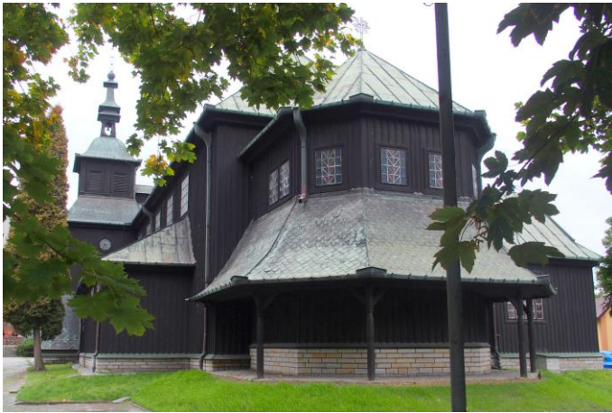
Fot. nr 3. Kościół pw. Najświętszego Serca Jezusowego, ul. Poniatowskiego 4

Spośród obiektów sakralnych najbardziej wartościowymi pod względem walorów architektonicznych, artystycznych i historycznych są: