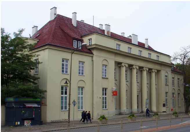
Fot.1. Budynek Poczty, Al. 3 Maja 12

Wymienieni architekci i urbaniści byli twórcami najważniejszych obiektów architektonicznych Ostrowca Świętokrzyskiego powstałych w okresie 4 ćw. XIX w.-lata 50. XX w. Najcenniejszymi, ze względu na unikatowość architektury są budynki: