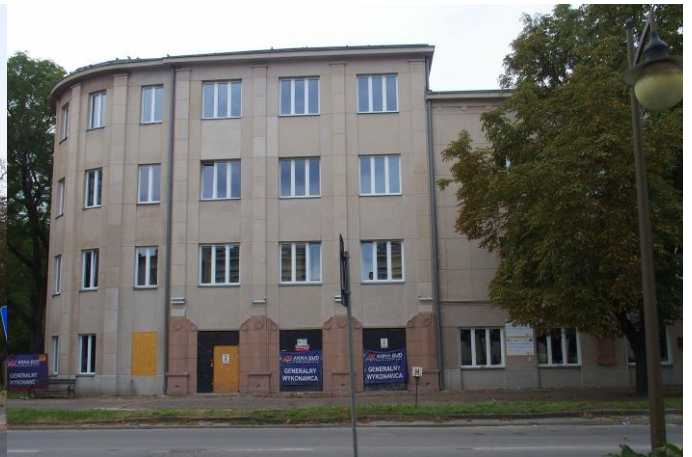
Fot. 2. Dom Robotniczy, Zakładowy Dom Kultury, ob. m.in. kino „Etiuda” i Centrum Tradycji Hutnictwa, Al. 3 Maja 6

Gmach Poczty , Aleja 3 Maja 12, wzniesiony w latach 1926-1927 wg projektu Witolda Minkiewicza. Dwukondygnacyjny budynek nakryty wysokim czterospadowym dachem, z rozległą facjatą w szerokości płytkiego frontowego ryzalitu. Wyróżnia się monumentalną kolumnadą w stylu palladiańskim wprowadzoną w prostokątnym podcieniu frontowego ryzalitu. Walorem budynku jest prostota i monumentalizm bryły niemal pozbawionej detali zdobniczych.