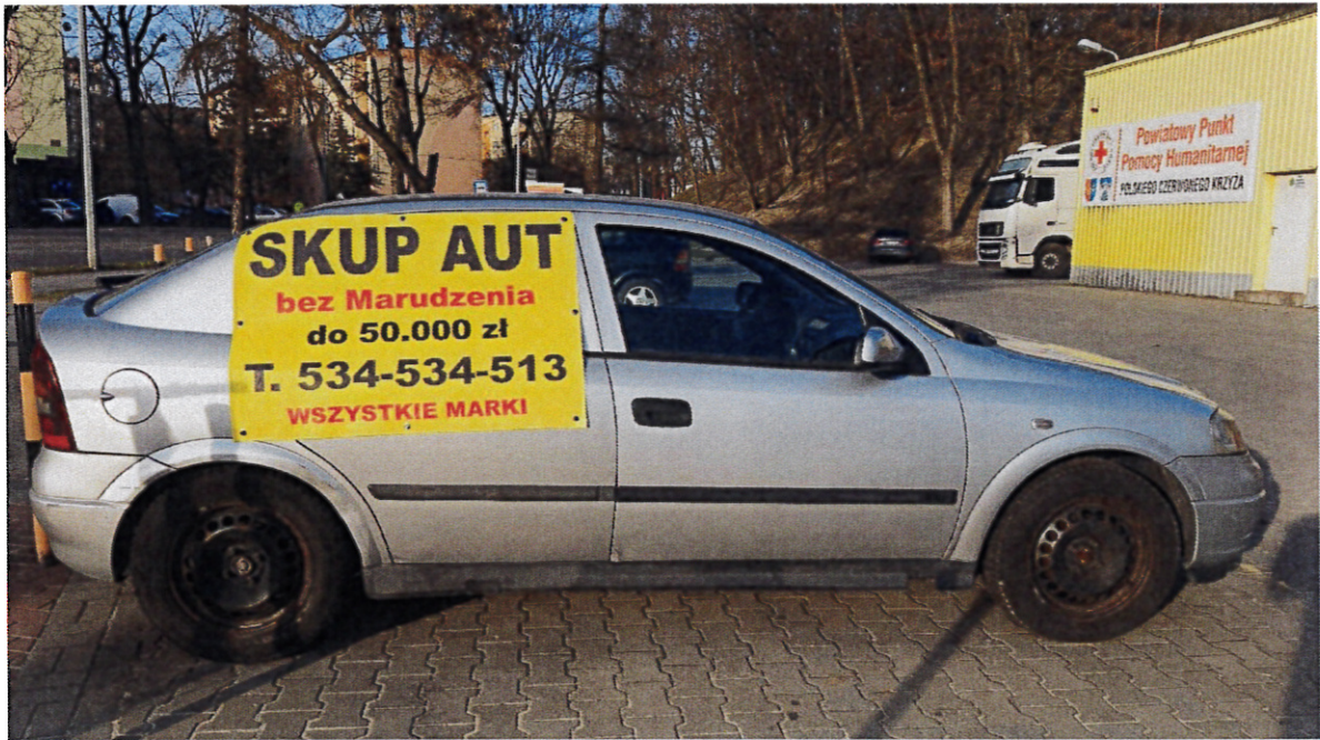
2. Parking przy ul. Polnej vis a vis Hali Handlowej