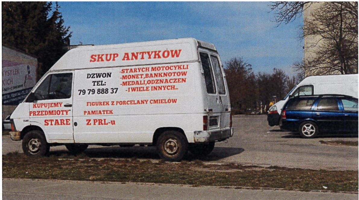
3. Parking przy markecie Carrefour ul. Hłżecka