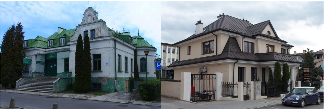
Fot. nr 9. Pałacyk Rylla, ob. budynek nieużytkowany, Al. 3 Maja 13a Fot. nr 10. Willa Żakowskich, ul. Siennieńska 14

Inne reprezentacyjne budynki mieszkalne na terenie Ostrowca Świętokrzyskiego to: dworek administratora dawnej cukrowni, tzw. Dyrektorówka, ob. budynek mieszkalny, zbudowany w 1877 r., opuszczony i zaniedbany, podobnie jak willa dyrektora Huty Klimkiewiczów przy ul. Focha wzniesiona na przełomie XIX/XX w. Wśród willi miejskich w krajobraz kulturowy Ostrowca wpisały się: