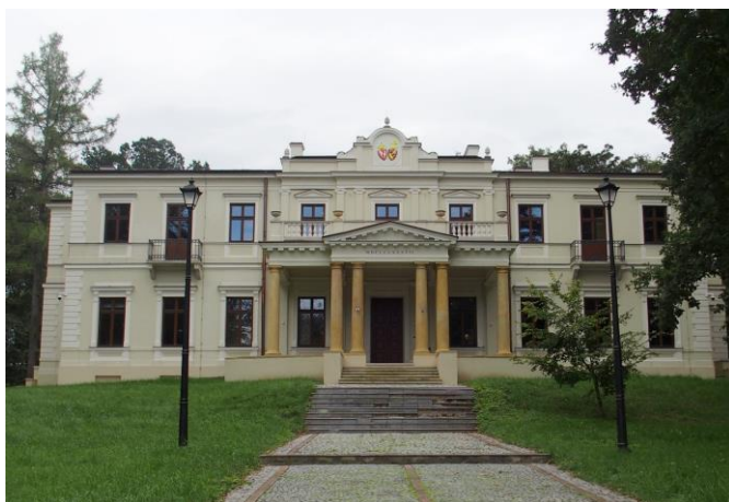
Fot. nr 7. Pałac Wielopolskich, ob. Muzeum Historyczno-Archeologiczne ul. Świętokrzyska 37

Budynek dawnej Kasy Chorych, ob. Środowiskowy Dom Samopomocy dla Osób Niepełnosprawnych Intelaktnie oraz Dom Ulgi w Cierpieniu im. Jana Pawła II, ul. Focha 5. Zbudowany w latach 1925-1927, zbudowany wg projektu R. Weindlinga (?) - nietypowy dla twórczości tego modernistycznego architekta, gdyż prezentuje walory neobaroku. Monumentalny, założony na rzucie litery E, trójkondygnacyjny, nakryty wysokimi czterospadowymi dachami rozczłonkowanymi lukarnami. Na osi fasady i w narożach elewacji - ryzality, z których fasadowy zwieńczony jest rozległą, prostokątną facjatą z trójkątnym szczytem. W wystroju fasady dominują pilastry w porządku wielkim, z jońskimi głowicami. Budynek po remoncie.