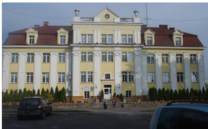
Fot. 6. Kasa Chorych, ob. Hospicjum Dom Ulgi w Cierpieniu im. Jana Pawła II, ul. Focha 5

Bank Pfeffera, ob. Komenda Powiatowa Policji, Al. 3 Maja 7 , wg projektu Stefana Szyllera. Dwukondygnacyjny, o symetrycznie skomponowanej fasadzie podzielonej ujętą w gzymsy strefą międzykondygnacyjną, w trzech osiach środkowych wzbogaconą obszernym balkonem wspartym na konsolach. Poziomo boniowany parter przeparty jest prostokątnymi oknami ze zwornikami w nadprożu, okna piętra - zamknięte łukiem okrągłym - zestawione po trzy, ujęte są szerokimi opaskami z dekoracją płycinową na wysokości węgarów; między oknami osi środkowych i w narożach wprowadzono pary pilastrów. Jest to wystrój eklektyczny korzystający z zasobów elementów dekoracyjnych baroku i renesansu.