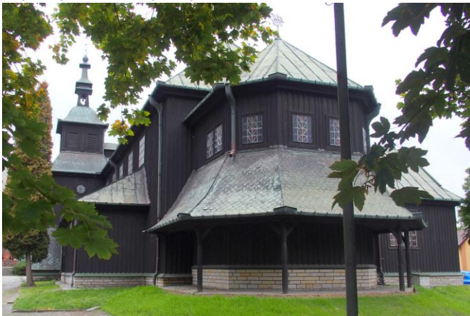
Fot. nr 3. Kościół pw. Najświętszego Serca Jezusowego, ul. Poniatowskiego 4

Spośród obiektów sakralnych najbardziej wartościowymi pod względem walorów architektonicznych, artystycznych i historycznych są: