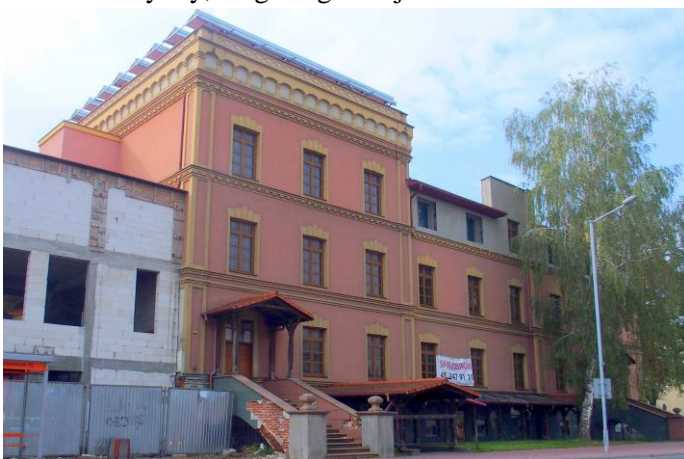
Fot. nr 13. Hotel Fabryczny, ul. Sandomierska 4

Pozostałe obiekty zabytkowe, wartościowe dla krajobrazu kulturowego miasta to dawny hotel fabryczny wzniesiony w 1905r., z elementami neogotyckimi w wystroju, ob. remontowany budynek dworca PKP wzniesiony w latach 1885-1886, w stylu typowym dla budynków dworców kolejowych tego okresu; obiekt nieczynny, ulega degradacji.