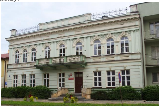
Fot. nr 5. Bank Pfeffera, ob. Komenda Powiatowa Policji, ul. Al. 3 Maja 7

Spośród innych budynków, ze względu na prezentację walorów stylów historycznych, wymienić należy: