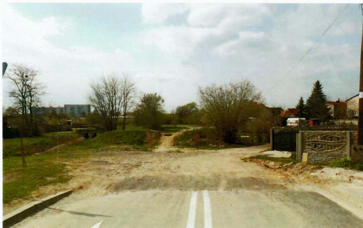
Wyjazd z ul Dunalka do ul. Bałtowskiej