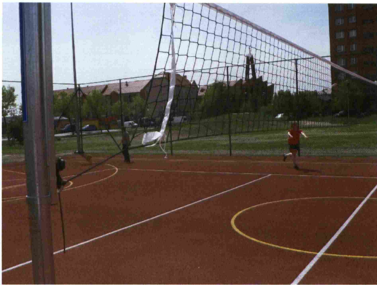
Zdj.2 Boisko z nawierzchni poliuretanowej.