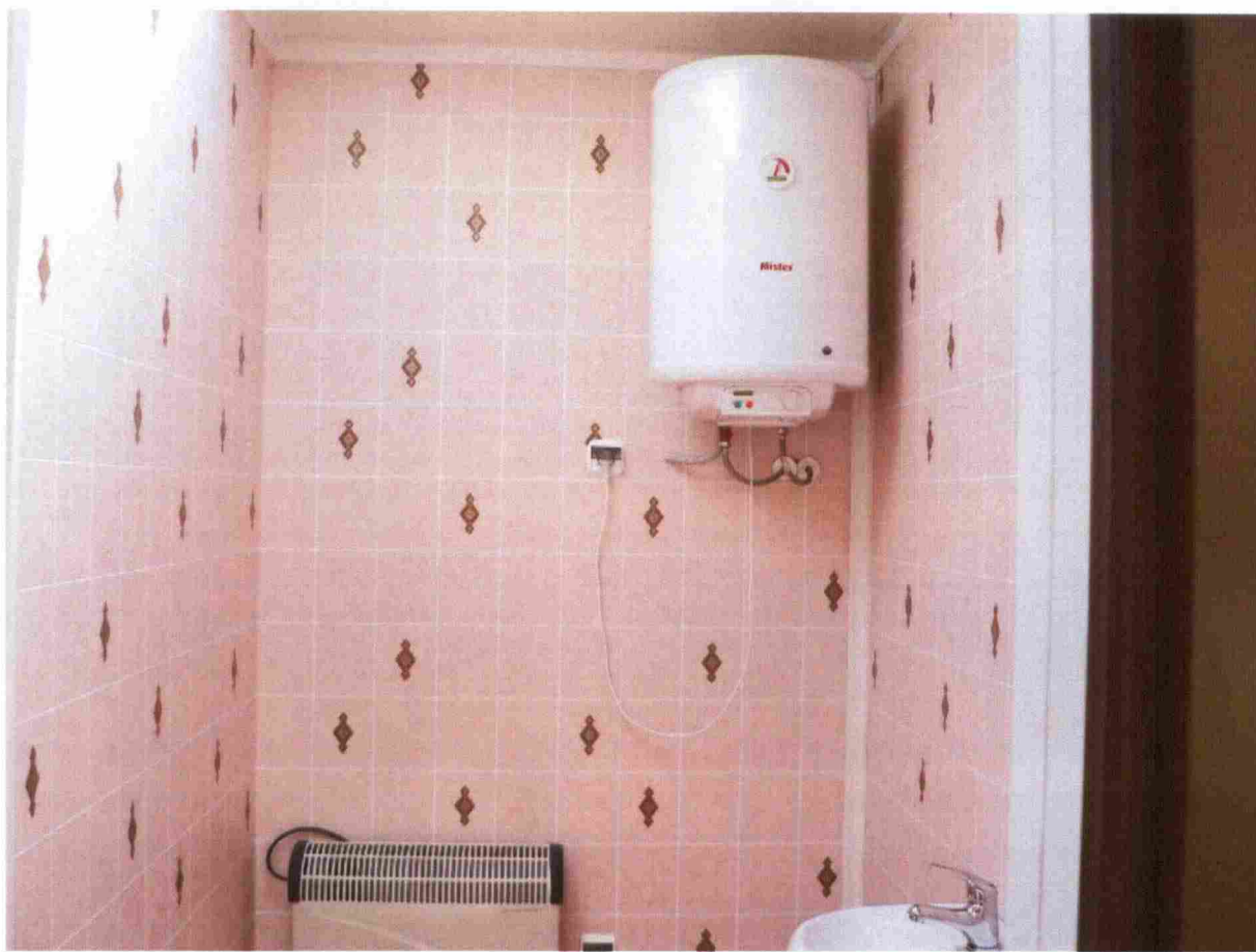
Zdj. 5 Wnętrze pomieszczenia sanitarno – szatniowego.