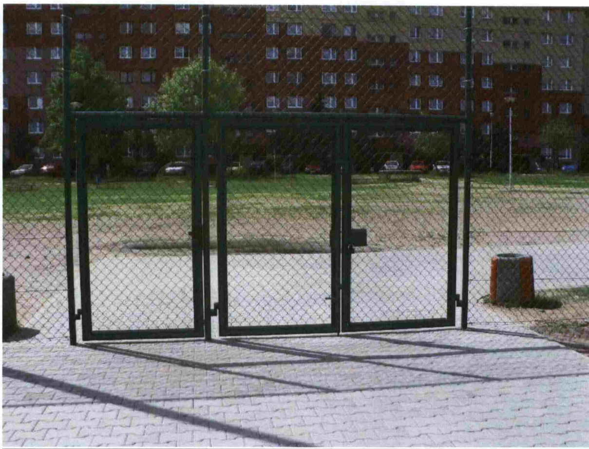
Zdj.1 Wejście na teren boisk sportowych.

W trakcie przeprowadzonej kontroli zostały zaprezentowane boiska oraz wykonane zdjęcia, które lokalizują i potwierdzają istnienie inwestycji.