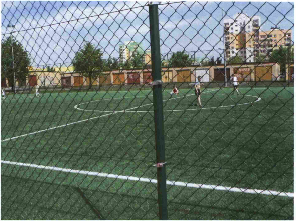
Zdj.3 Boisko o nawierzchni wykonanej z trawy sztucznej.