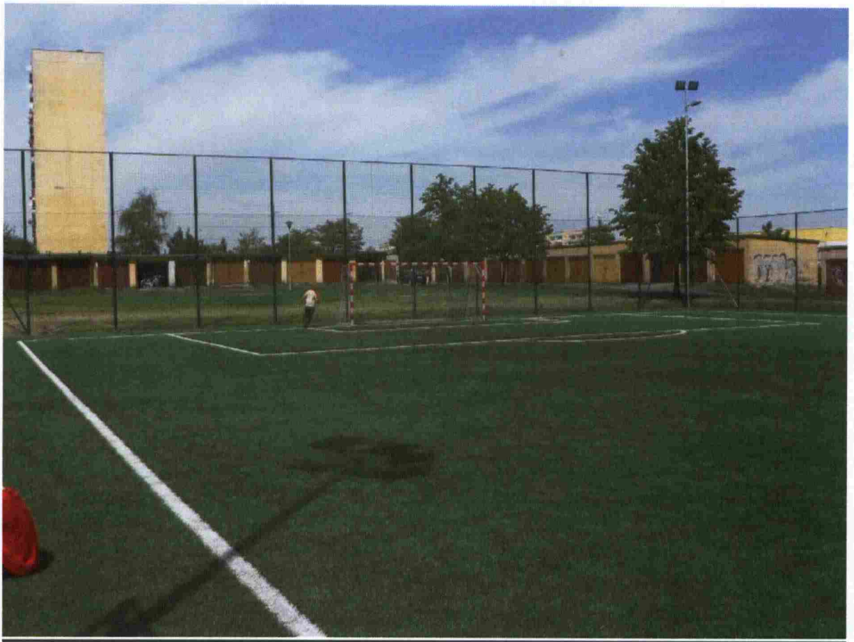
Zdj.4 W tle ogrodzenie boisk wraz oświetleniem zewnętrznym.