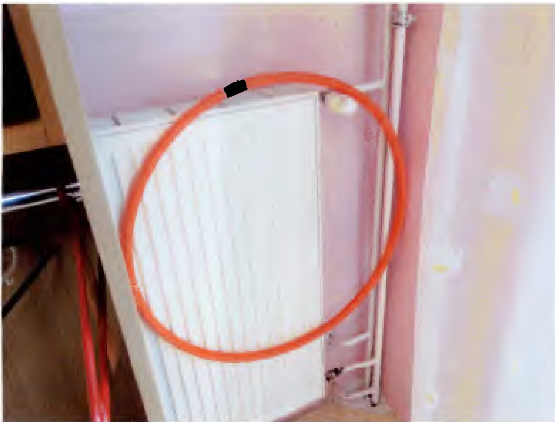
5. Publiczna Szkoła Podstawowa Nr 10, ul. Rzeczeki 18, 27-400 Ostrowiec Świętokrzyski - (zdjęcia od nr 25-32).