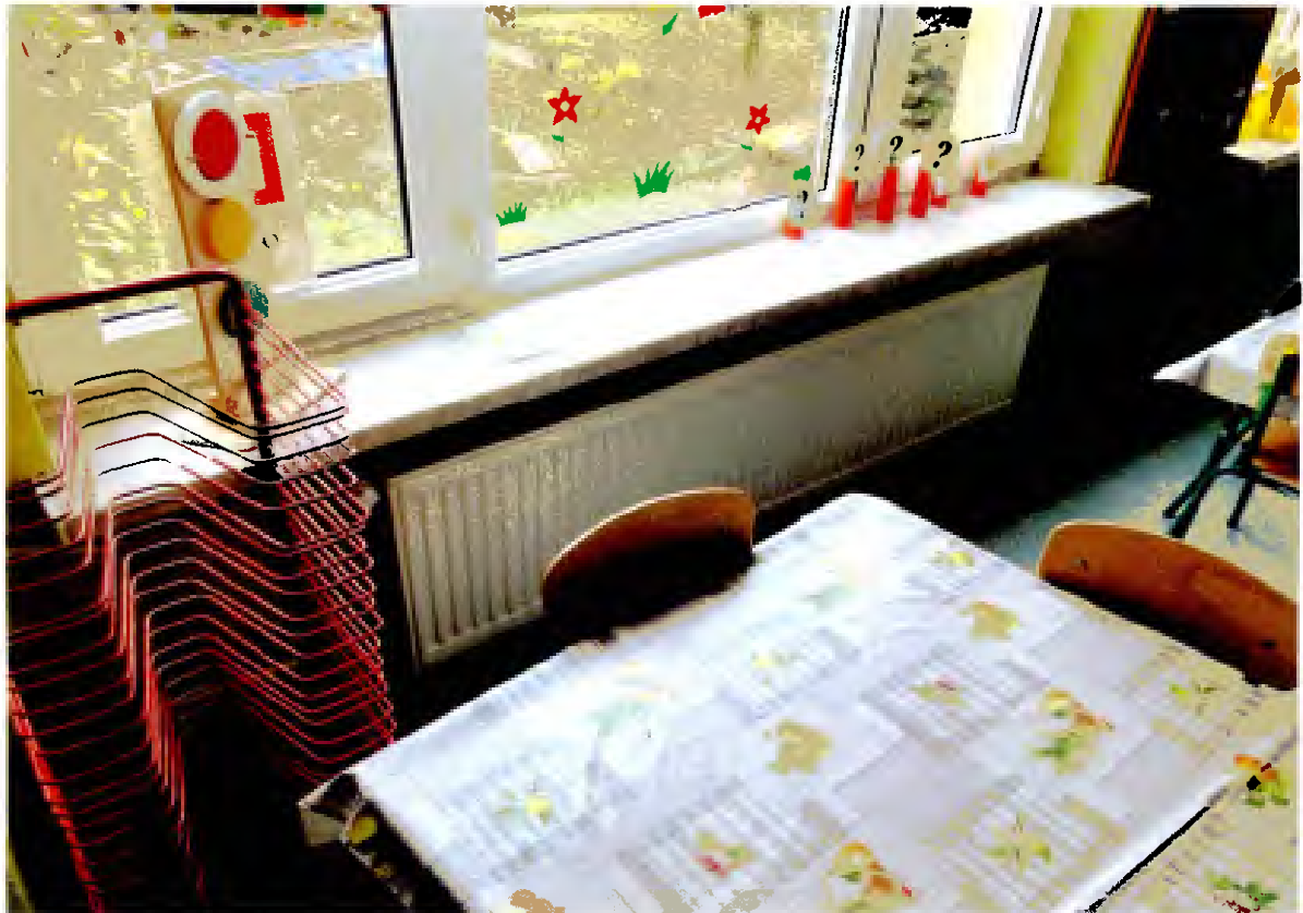
3. Zespół Szkół Nr 2, os. Stawki 35, 27-400 Ostrowiec Świętokrzyski – (zdjęcia od nr 11-18).