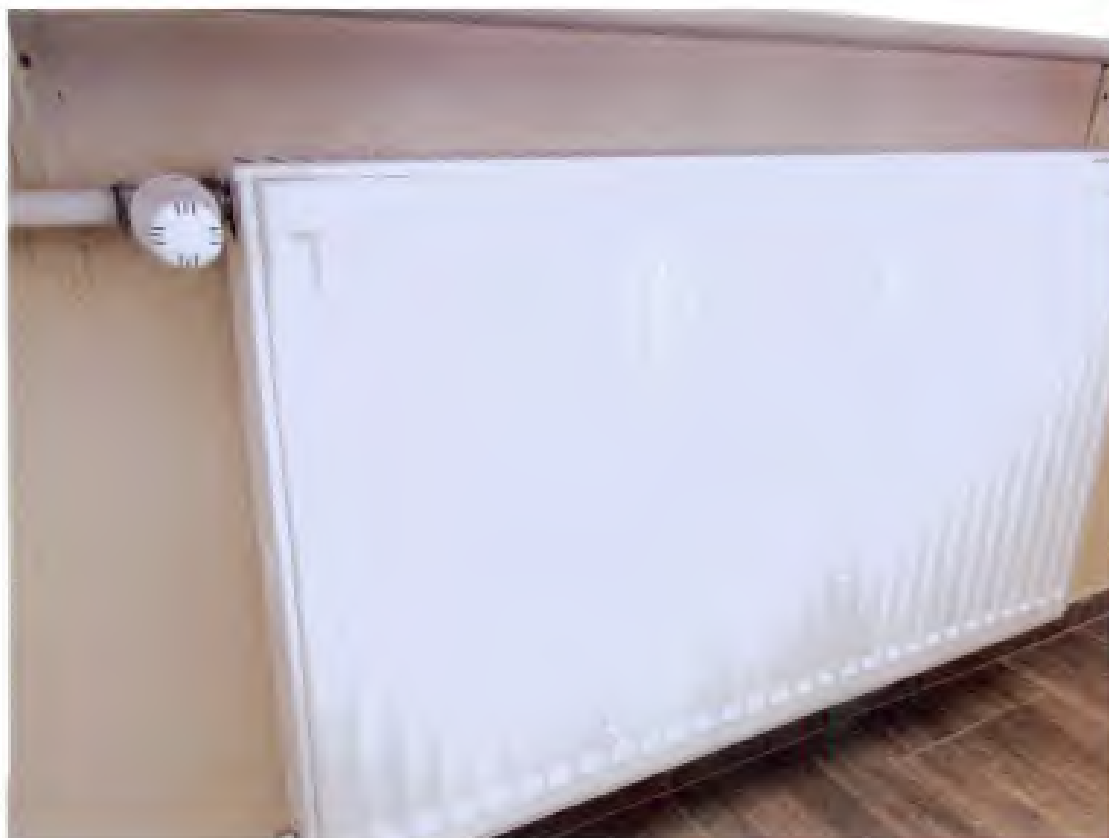
4. Publiczne Przedszkole Nr 11, ul. Wspólna 20, 27-400 Ostrowiec Świętokrzyski – (zdjęcia od nr 19-24).